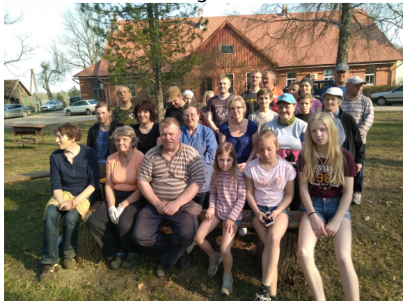
Urvaste kogudus on tegus

Toimus Urvaste koguduse lastelaager. Koguduse noored võtsid osa 13. aprillil Tallinnas Õismäe Sportmängude Hallis üle-eestilisest koguduste vahelisest