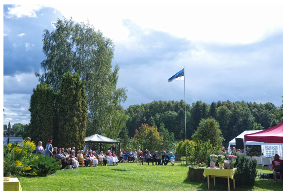
Räpina koguduse hooldekodu 25. aastapäeva tähistamine hooldekodu õuel

Peetakse ka apostlite mälestuspäevi. Omaks on võetud Ülestõusmispühadeöö Vigilia, ristitee palvus Suurel Reedel, Hingedepäeva hardusethk Ristipalo kalmistul, mille järel asetatakse küünlad kirikuvanemate haudadele ja Taizé palvused.