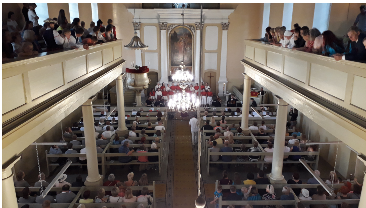
Laulupeotuli ja kontsert Räpina kirikus

Kirikut külastas ka oma Kagu – Eesti tuuril president Kesrit Kaljulaid, kes jättis oma head soovid ka külalisteraamatusse.