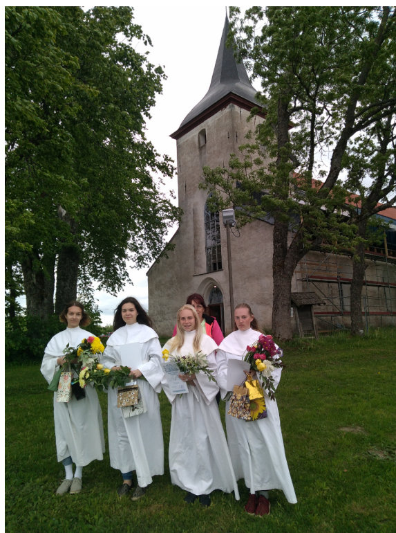
Leerilapsed Urvaste kiriku ees

jalgpalliturniirist „Koguduste Karikas“. Finaalis kohtuti Türi Misjonikogudusega ja päras 0:0 lõppenud normaalaega kaotati penaltiseerias, saavutades nii turniiril teine koht.