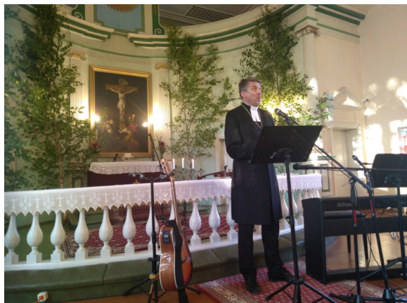
Peapiiskop Urmas Viilma Võru kirikus kõnelemas

Arvukalt oli Võru kirikus kontserte ning seda soodustab asukoht linna keskel. Keskküte võimaldab kirikut aastaringelt kasutada jumalateenistuste, talituste kui kontserditeks.