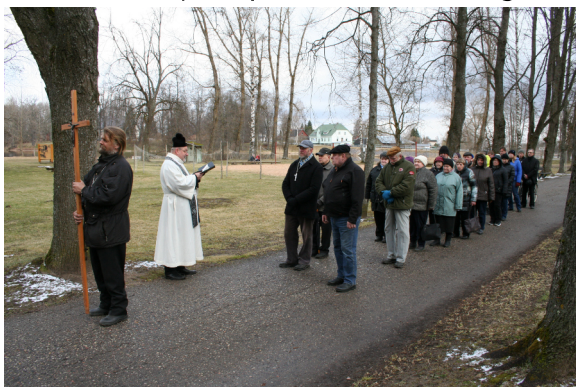
Suure Reede ristitee palvusel osalejad

Lisaks peakirikule toimuvad jumalateenistused või palvused kahes hooldekodus ja Räpina taastusravihaiglas.