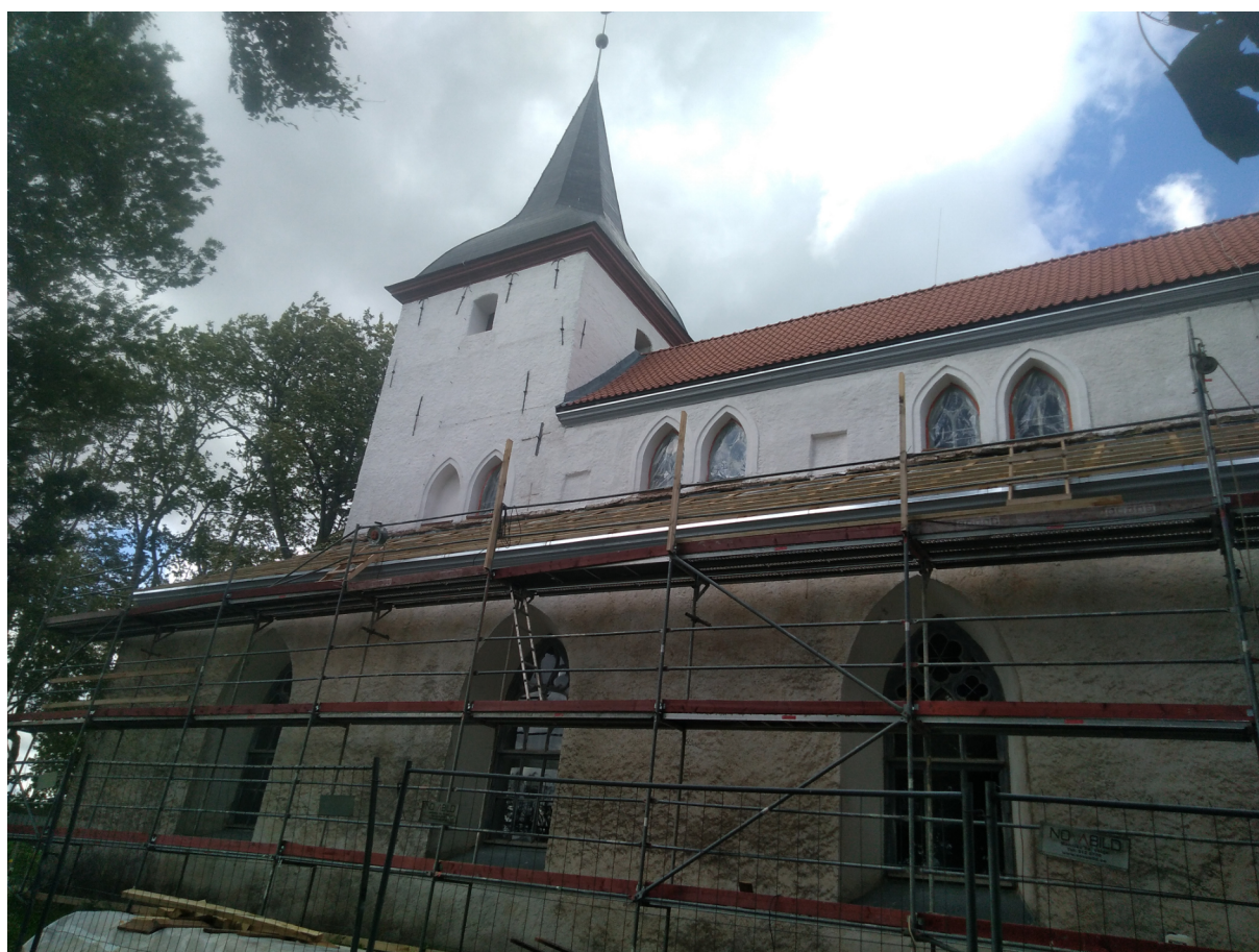
Tellingutes Urvaste kirik

Õunaaed andis 5 tonni õunu, mida korjati ühiselt ja saadud rahaga remonditi kogudusele kuuluv väikebuss.